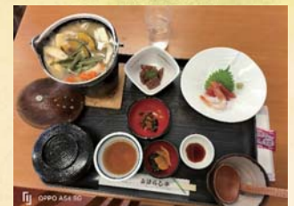
4 日目ほうとう鍋定食