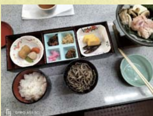
1 日目朴葉陶板焼き