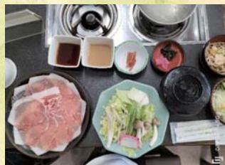
2 日目信州豚しゃぶしゃぶ