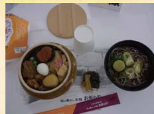
3 日目目峠の釜めし